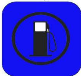
НАЧАЛО НА ЗОНА ЗА ЗАРЕЖДАНЕ

Цвят на фона: ЖЪЛТ Цвят на контролата: ЧЕРВЕН