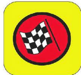
ЛИНИЯ НА ЛЕТАЩИЯ ФИНАЛ

Цвят на фона: ЖЪЛТ Цвят на контролата: ЧЕРВЕН