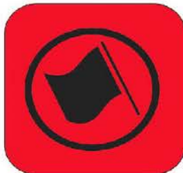
СТАРТ НА СЕ

Цвят на фона : ЖЪЛТ Цвят на контролата: ЧЕРВЕН