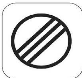
КРАЙ НА ЗОНАТА ЗА КОНТРОЛ