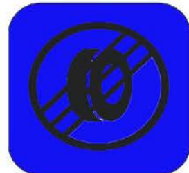
КРАЙ НА ЗОНА ЗА МАРКИРАНЕ/ПРОВЕРКА ГУМИ