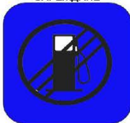
КРАЙ НА ЗОНА ЗА ЗАРЕЖДАНЕ