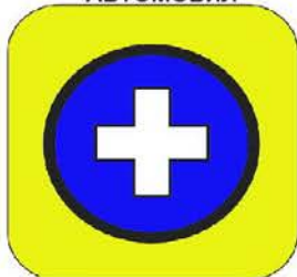
ПУНКТ НА МЕДИЦИНСКИ АВТОМОБИЛ

Цвят на фона: ЖЪЛТ Цвят на контролата: СИН